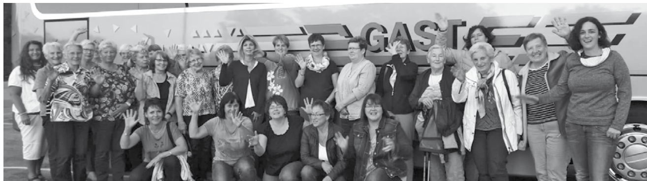
Fröhliche Gesichter nach der Landfrauenreise in die Innerschweiz.