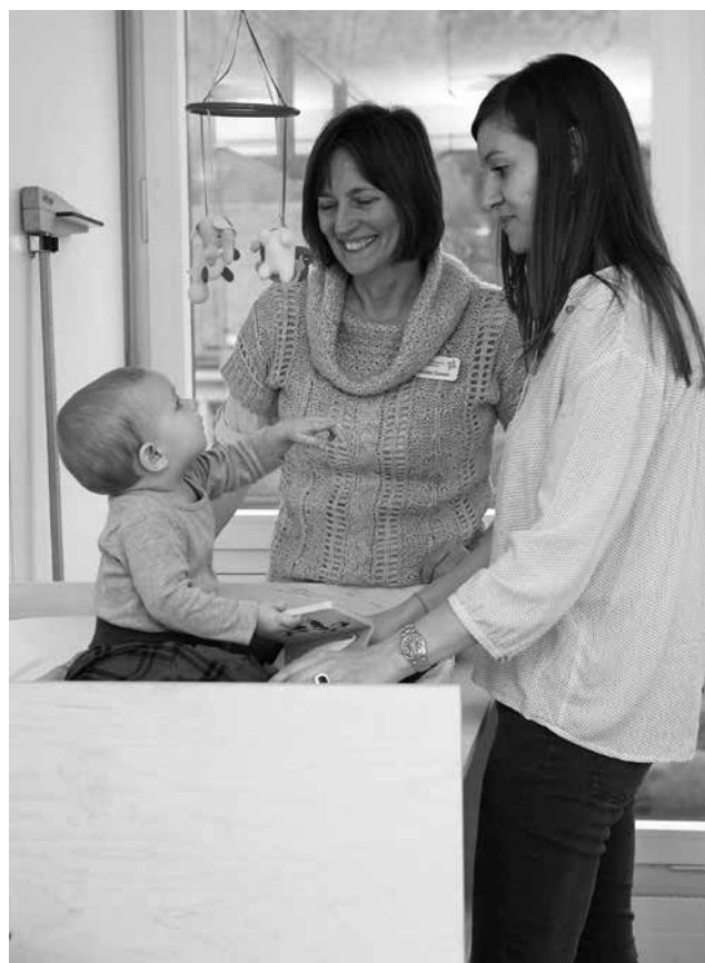
Eine Mütter- und Väterberaterin bespricht individuelle Themen mit den Eltern.

Bitte bringen Sie Massageöl, Wickelutensilien, ein grosses Badetuch, eine kleine Decke und bequeme Kleidung mit.