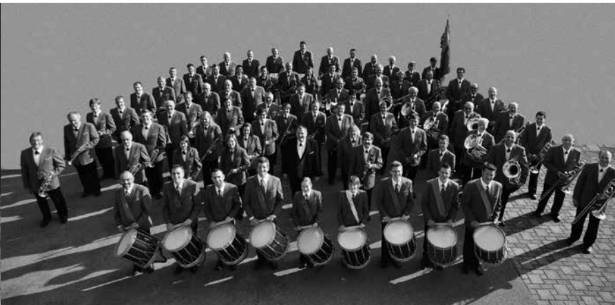
harmonie bätterkinden – heute