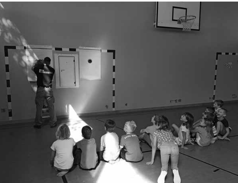
Aufmerksam am Zuhören.

Unter dem Motto «Nicht mit mir» wurde an zwei Mittwoch-Nachmittagen mit der Securitas zusammen dieser Kurs durchgeführt. Die Kinder lernten mit alltäglichen Konfliktsituationen richtig umzugehen und vor allem die Gefahren und Risiken zu erkennen. Auch wenn es einmal zu einem Notfall kommen würde, wie sie sich schützen und verteidigen können. Es wurden natürlich auch verschiedene Szenarien aufgezeigt und geübt. Solche Kurse sind sehr wichtig um die Kinder zu schützen und ihr Selbstvertrauen zu stärken.