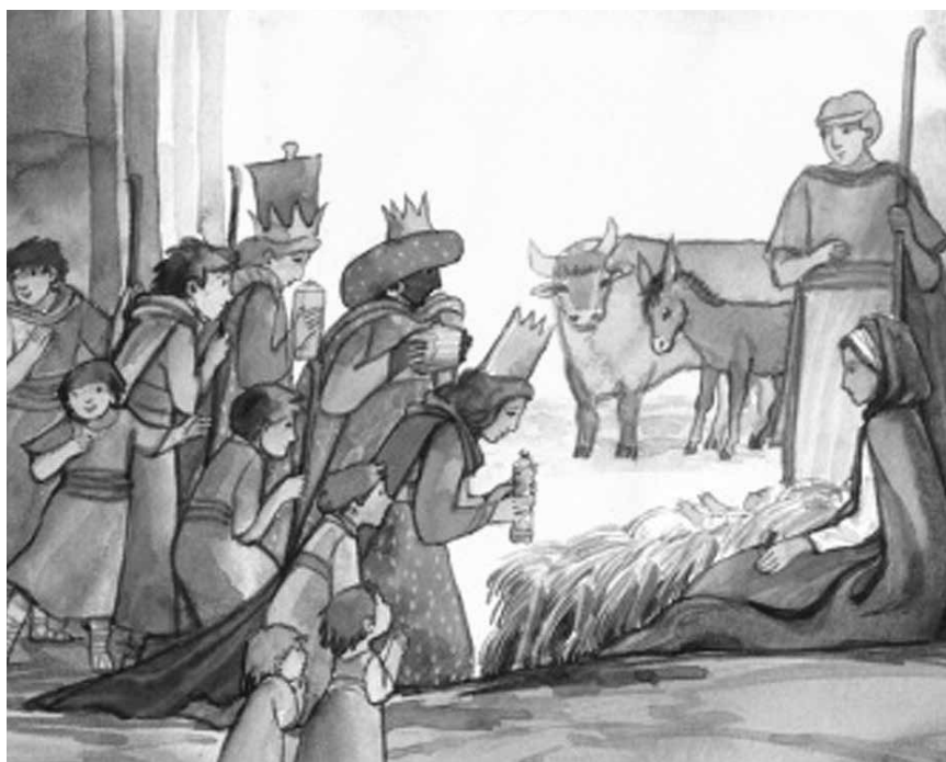
Im Stall in Bethlehem.

Fiire mit de Chliine ist eine halbstündige Feier für Kinder ab zirka zwei Jahren mit ihren Eltern, Grosseltern und Geschwister. Alle kleinen und grossen Besucherinnen und Besucher sind herzlich willkommen. Die Feier findet am Samstag, 8. Dezember 2018, um 10.00 Uhr, in der Kirche statt.