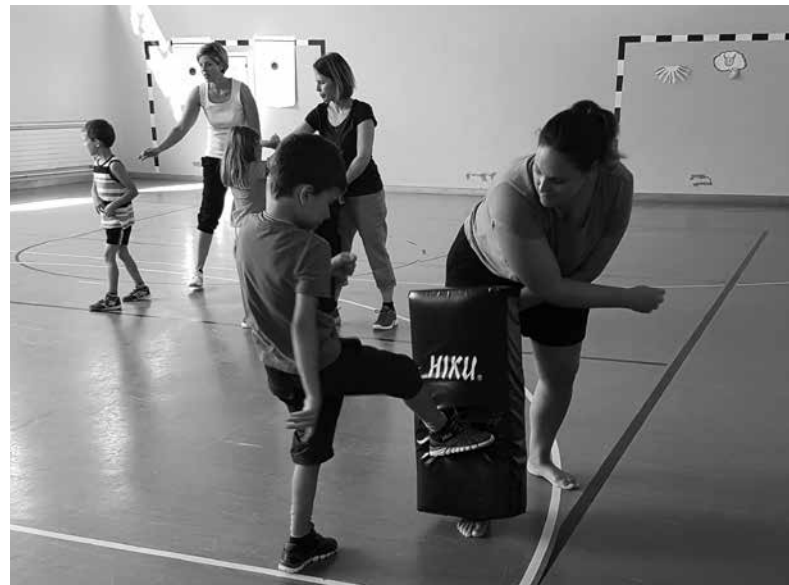
Das Gelernte wird umgesetzt.

Der ganze Vorstand des Elternclubs Bätterkinden-Krälligen wünscht allen Mitgliedern eine