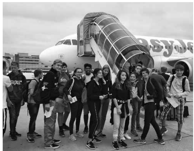
Vor dem Abflug nach Prag.

Die Schülerinnen und Schüler der 9. Realschulklasse 2018