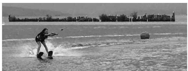
Im Neopren-Anzug machts doppelt Spass!

Wir danken den Lehrern, die mitgekommen sind und diese Landschulwoche geplant haben.