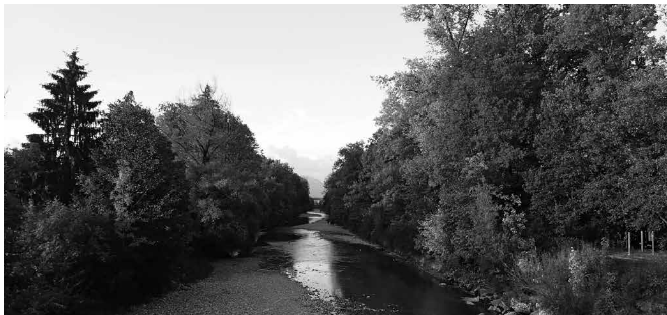
An der Emme gibt es zu jeder Jahreszeit ein wunderbares Bild.

Wir freuen uns auf zahlreiche Teilnahmen.