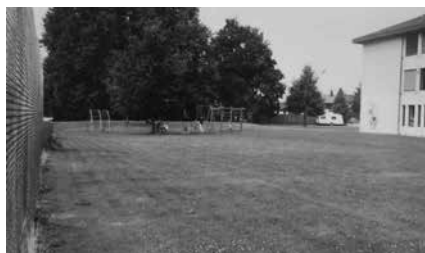
1995: Kaum genutzte Rasenfläche.

In verschiedenen Fächern können wir den Unterricht draussen in der Natur abhalten: Pflanzen und Tiere beobachten, bestimmen, abzeichnen, eine Schatzsuche durchführen, Hütten und Brücken bauen und Rollenspiele machen. Für viele Kinder ist der Naturspielplatz auch in der Freizeit ein beliebter Treffpunkt.