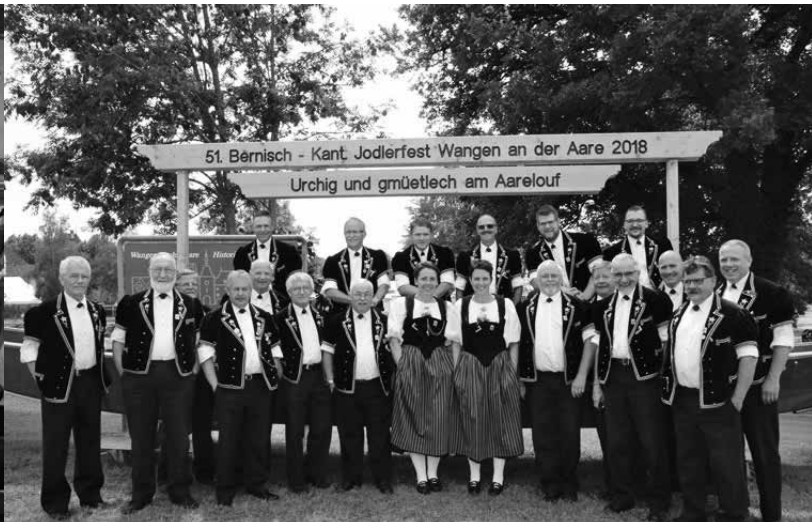
Jodlerklub «Bärgbrünneli» Koppigen am Bernisch - Kantonalen Jodlerfest Wangen an der Aare 2018.