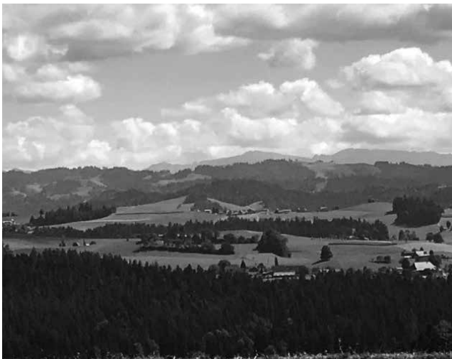
Aussicht «Höger und Chräche».

Wir freuen uns, jedes Jahr, einige unterhaltende Anlässe für die Bevölkerung anbieten zu dürfen. In diesem Jahr starteten wir unsere Aktivitäten am 2. Februar 2018 mit dem Improvisationstheater «ImproVISION» aus Solothurn. Stolz können wir sagen, wir hatten in der Aula «volles Haus». Das Kasperli-Theater fand am 17. März 2018 statt. Kinder ab vier Jahren und ihre Angehörigen waren begeistert und der Platz in der Aula reichte nur knapp aus. Mit dem Ferienspass, welchen wir jeweils zusammen mit Utzenstorf organisieren, konnten wir zahlreiche Angebote zur vollen Zufriedenheit aller Beteiligten durchführen. Das Programm war sehr abwechslungsreich und wurde von den Kindern sehr rege genutzt.