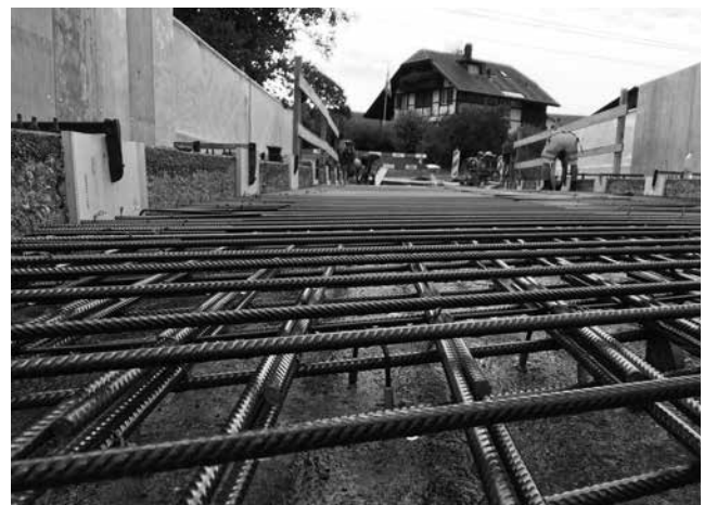
Die Brücke während den Sanierungsarbeiten.

Die Brücke ist auf eine Maximallast von 18 Tonnen ausgelegt. Der RBS hat in der Vergangenheit wiederholt festgestellt, dass die Höchstgewichtsbeschränkung der Brücke von maximal 18 Tonnen mehrfach missachtet wurde. Der RBS bittet deshalb die Nutzerinnen und Nutzer, die Gewichtsbeschränkung zu respektieren und diese einzuhalten. Das Verbot für schwerere Gefährte mit mehr als 18 Tonnen Gesamtgewicht wurde vor allem aufgrund von Aspekten der Sicherheit (Bahn / Motorisierter Individualverkehr) errichtet.