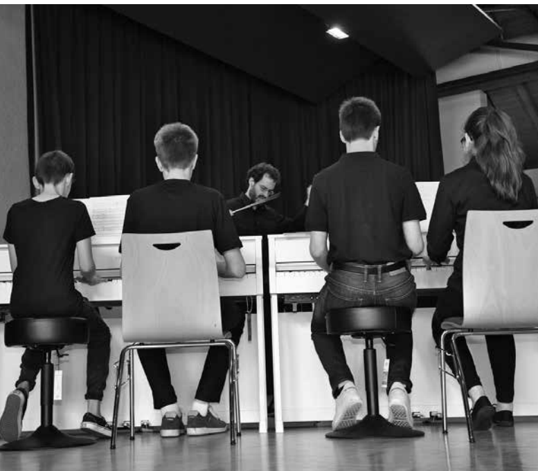
Viele Hände auf noch mehr Tasten.

Text & Bild: Orestis Chrysomalis, Stv. Schulleitung der Musikschule Jegenstorf