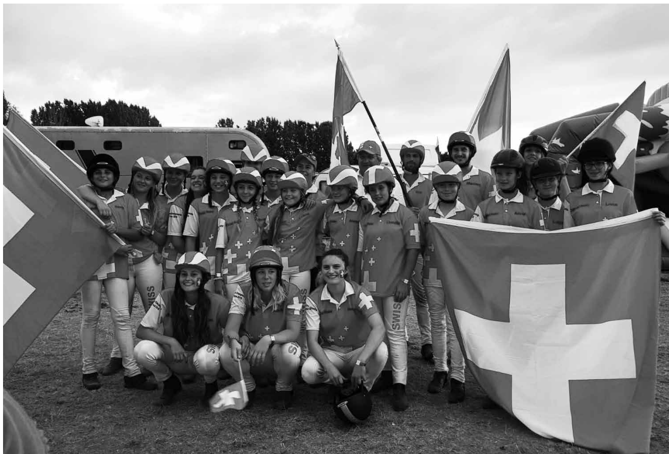
Schweizer Kader Team 2018 in La Bonde, Frankreich.