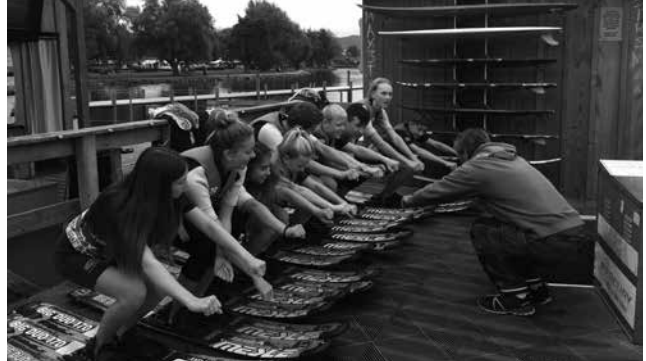
Warm up vor dem Wasserski-/boardfahren.

Am nächsten Morgen bestiegen wir den Zug Richtung Neuenburg. Da machten wir einen Postenlauf, der durch ganz Neuchâtel führte und während dem wir die Stadt ein bisschen besser kennen lernen durften. Wir hatten drei Stunden Zeit, um alle Posten zu erledigen. Am späten Nachmittag schwamm uns ein Schiff nach Estavayer-le-Lac zurück. Die Hälfte unserer Klasse gönnte sich eine Abkühlung im Neuenburgersee. Nach dem zweiten Abendessen begann ein Unterhaltungsabend, der von Musik und viel Spass geprägt war. Um 23.00 Uhr sollten wir schlafen... Die ersten zwei Tage waren sehr lustig.