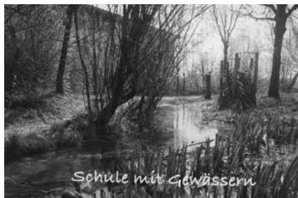
Heute: Natur pur.