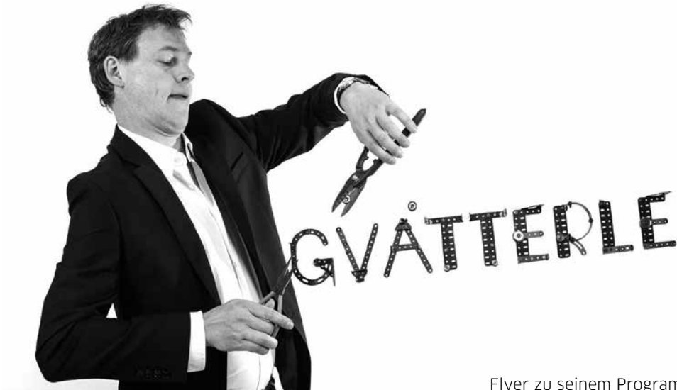
Flyer zu seinem Programm.