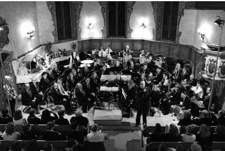
Die Musikgesellschaft Bätterkinden am Kirchenkonzert.