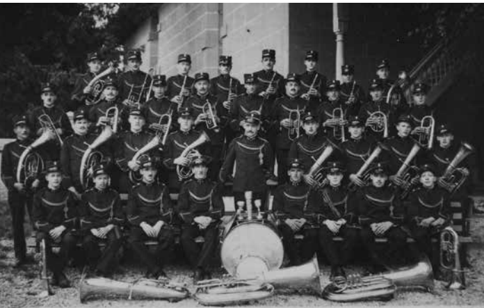
Arbeitermusik Bätterkinden – früher.